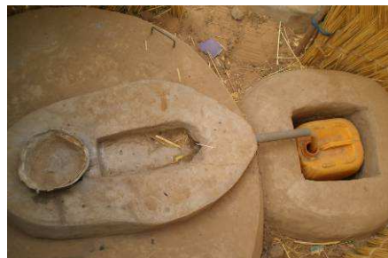
La latrine à compost (Fossa alterna) avec séparation d'urine