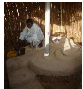
La latrine sèche en matériaux locaux sauf la dalle et le tuyau de ventilation.