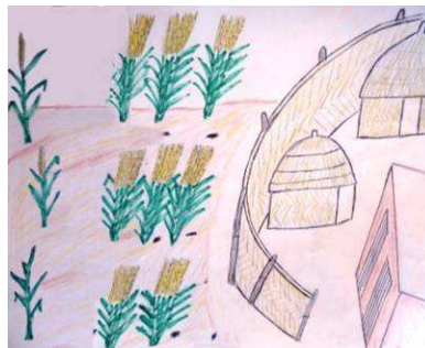
“Les champs proche du village” : La plupart des villageois reconnaissent que les récoltes sont meilleures dans les champs proches du village, et que cela est dû aux déchets humains. AP devient une façon d'améliorer ce qui existe déjà