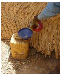
Un bidon, un entonnoir et une ampoule fonctionnent comme un urinoir simple. Enterré, il est adapté pour la position accroupie.