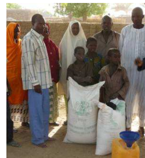
“Une famille = deux sacs” . A Aguié les fertilisants dans les excréta d'une famille moyenne (9 personnes) correspondent à peu près à un sac d'urée (50 kg) et un sac de NPK.

Le message central est qu'une bonne utilisation des latrines et des urinoirs permet d'éliminer les dangers et capter les ressources. Pour renforcer ce message, l'on parle de la transformation de l'urine en Takin Ruwa (engrais liquide) et des fèces en Taki Busasché (engrais solide). Cette transformation est faite par le stockage. L'urine est stockée 1 mois et les fèces 6 mois pour les latrines sèches hors sol et 12 mois pour les latrines à compost. Ces recommandations sont basées sur les directives de l'OMS (2006) et prennent en compte le climat très sec et chaud qui favorise la destruction des pathogènes.